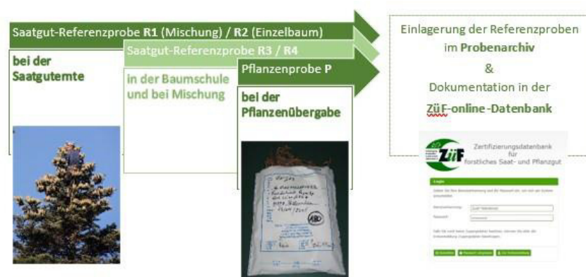
Abb. 1: Ablaufschema bzgl. Referenzproben im Zertifizierungssystem ZüF.

Bei der künstlichen Waldverjüngung ist die Wahl der passenden Herkunft ausschlaggebend für die Stabilität und Produktivität des zukünftigen Bestandes. Bei Pflanzen, die mit einem ZüF-Zertifikat ausgeliefert werden, ist deren Abstammung von einem bestimmten Erntebestand, d. h. ihre Herkunft überprüfbar während des gesamten Produktionsprozesses bis zur Auslieferung an den Waldbesitzer. Dazu werden bei der Ernte genau gekennzeichnete Referenzproben zurückgelegt, die nach festgelegten Regeln gezogen wurden. Bei der Auslieferung der Pflanzen kann der Abnehmer auch eine Referenzprobe, diesmal eine Pflanzenprobe, ziehen. Der genetische Vergleich zwischen dieser Pflanzenprobe und zurückgelegter Saatgutprobe, aus der sie laut Begleitpapieren stammen sollte, kann Aufschluss geben, ob dies tatsächlich so ist. Eine genaue, lückenlose und zeitnahe Dokumentation aller Bewegungen von Saat- und Pflanzgut jeder ZüF-Partie in der online-Datenbank ist das zweite entscheidende Instrument bei der ZüF-Zertifizierung (Abb. 1).